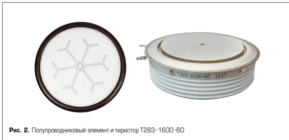
Рис. 2. Полупроводниковый элемент и тиристор T283-1600-60

ния. При этом габаритно-присоединительные размеры ВТВ при модернизации должны быть сохранены. Предпочтительным вариантом для новых ВТВ является применение более мощных и высоковольтных тиристоров для сокращения числа последовательно соединенных приборов и комплектующих (охладители, защитные цепи, драйверы управления).