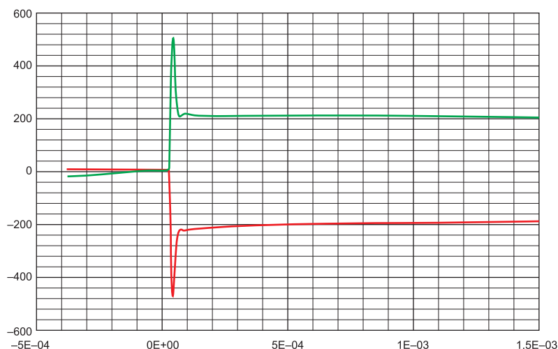
Рис. 3. Распределение напряжений в процессе обратного восстановления пары тиристоров, подобранных по осциллограммам токов обратного восстановления