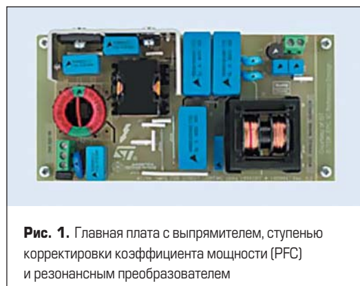
Рис. 1. Главная плата с выпрямителем, ступенью коррективы коэффициента мощности (PFC) и резонансным преобразователем

Ключевыми характеристиками этого типа конструкции являются высокий коэффициент по-