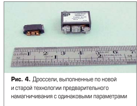
Рис. 4. Дроссели, выполненные по новой и старой технологии предварительного намагничивания с одинаковыми параметрами

Технология предварительного намагничивания сердечников позволяет удвоить значение индуктивности дросселя без изменения тока, либо удвоить значение тока при неиз-