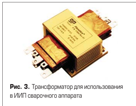
Рис. 3. Трансформатор для использования в ИИП сварочного аппарата

Планарный трансформатор также хорошо вписывается в структуру источников питания для систем индукционного нагрева. Для этих целей, например, был выпущен трансформатор мощностью 20 кВт (рис. 3) и размерами 180×104×20 мм.