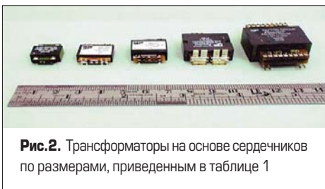
Рис. 2. Трансформаторы на основе сердечников по размерам, приведенным в таблице 1

Трансформаторы Payton идеально подходят для применения в ИИП для сварочных аппаратов. Трансформаторы отлично вписываются в структуру источника, гарантируя большую продолжительность его работы. Известно, что ИИП сварочных аппаратов генерируют критично высокие значения выходных токов. Поэтому вторичных витков в большинстве случаев всего несколько. Планарные трансформаторы подходят, таким образом, для работы с высокими значениями токов и могут исполь-