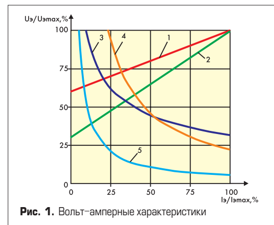
Рис. 1. Вольт-амперные характеристики